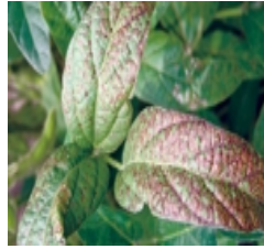
Cercospora kikuchii (Виолетова дамкавост)