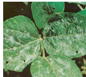
Microsphaera diffusa (Пепелница)