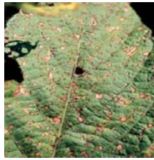
Cercospora sojina (Кафеава дамкавост)