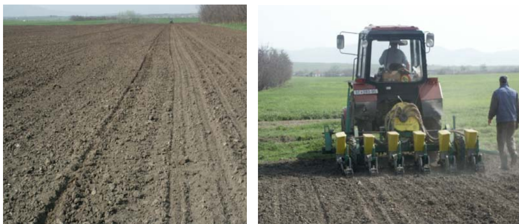
Слика 3 - Сеидба на соја со пневматска сеалка

Густината и начинот на сеидба се определува во зависност од условите на одгледување, сортата и групата на зрелост. Во наши услови, на големи површини сојата се сее во редови со меѓуредно растојание од 50 до 70 cm и со употреба на механички или пневматски сеалки приспособени за сеидба на соја.