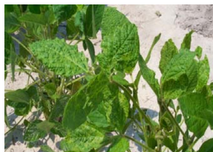
Bean pod mottle virus – BPMV (Мозаичен вирус кај сојата)