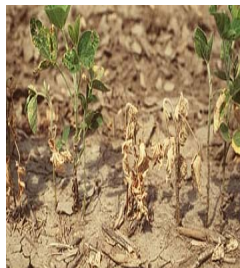
Phytophthora megasperma (Drechs.) var. Sojae