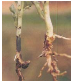
Rhizoctonia solani Kuhn. (Влажно гниење)