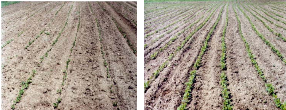
Слика 5 - Фаза V_1 - V_2 кога може да се изведува првото меѓуредно култивирање

За да не дојде до затрупување на редовите со првото култивирање е потребно на култиваторите да се постават заштитници и движењето да е со помала брзина. Втората меѓуредна обработка најчесто се изведува кога сојата е со височина од 20 до 30 cm. За меѓуредното механизано култивирање сојата не треба да се сее на помало меѓуредно растојание од 45 cm.