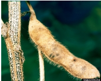
Diaporthe phaseolorum (Cke et Ell.) (Црна дамкавост – рак на стеблото)