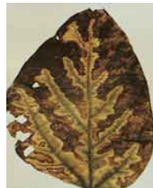
Phialophora gregata (Кафеава гниење на стеблото)