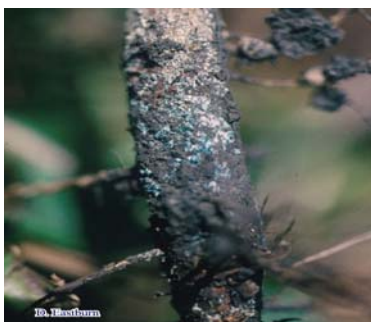
Fusarium solani f.sp. glycines . (Фузариози кај сојата)