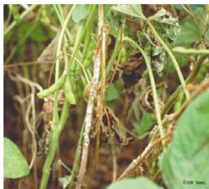
Sclerotinia sclerotiorum (Бело гниење)