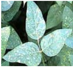
Peronospora manchurica (Пламеница)